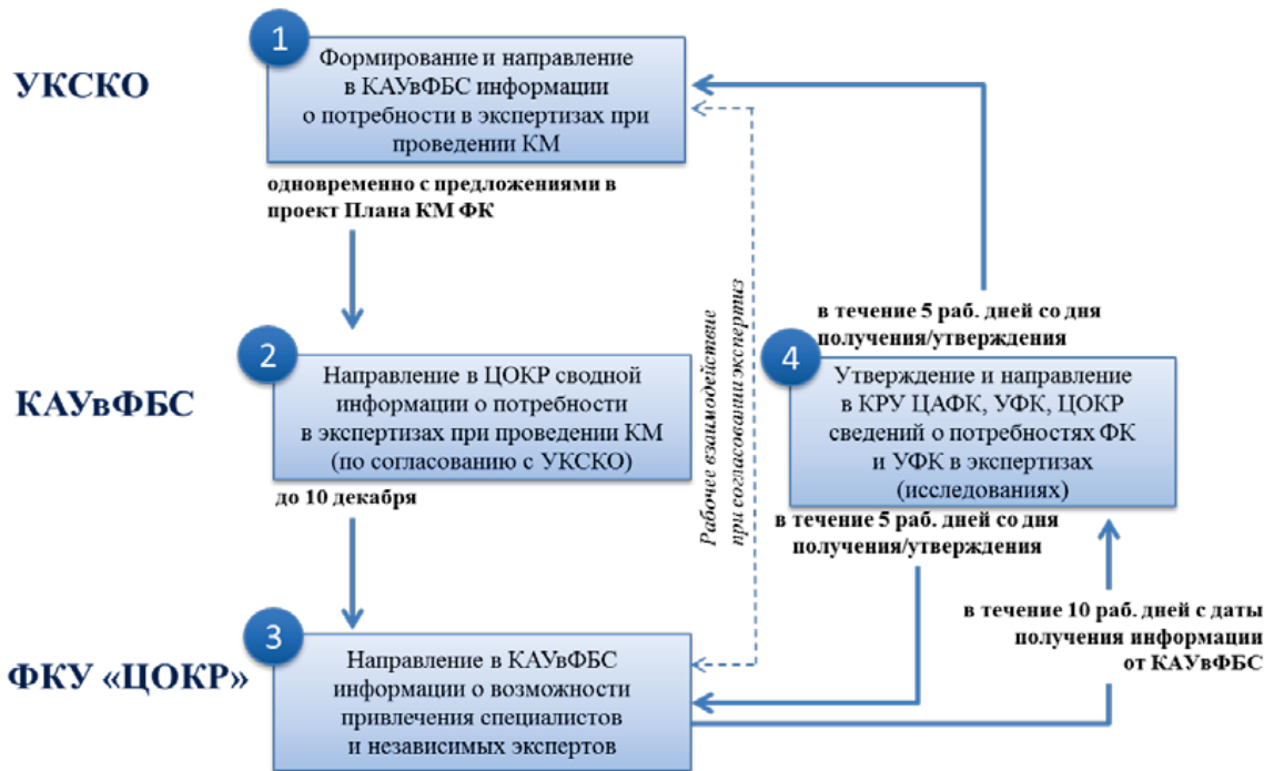
Схема взаимодействия УКСКО с ФКУ «ЦОКР» по привлечению экспертов (специалистов) при выполнении контрольных мероприятий